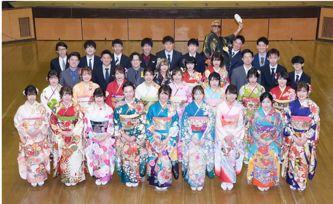
祝 成人 平針北学区 R2.1.12 天白区役所講堂

令和初の成人式。学区内で、57人の方が成人を迎えられました。新成人の皆さまとご家族の皆さまに心よりお祝いとお喜びを申し上げます。新成人の皆さんがさらに輝かれるよう願っています。