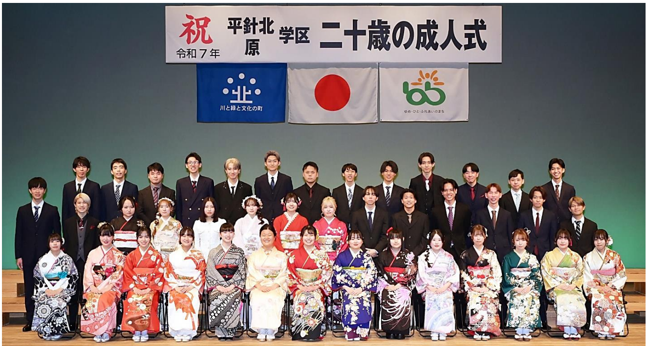
祝 二十歳の成人式 平針北学区 R7.1.12 天白文化小劇場

令和7年 平針北・原学区の【二十歳の成人式】を1月12日（日）天白文化小劇場において開催しました。平針北学区では78名の方が20歳を迎えられ43名が式典に参加されました。20歳を迎えられた皆さん誠におめでとうございます。併せて、ご両親をはじめ、ご家族の皆さまに心よりお祝いとお喜びを申し上げます。新しい時代を担う新成人皆さんのご活躍とご多幸をお祈りいたします。また、地元を誇りと愛着を持ち、新しい時代の街づくりに積極的にご参加いただきますことをお願い申し上げます。