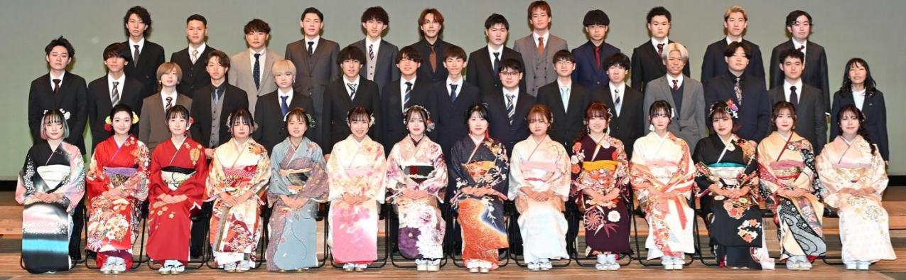
祝 二十歳の成人式 平針北学区 R6.1.7 天白文化小劇場

令和6年 平針北・原学区の【二十歳の成人式】を1月7日(日)天白文化小劇場において開催しました。平針北学区では70名の方が二十歳を迎えられ43名が式典に参加されました。二十歳を迎えられた皆さん誠におめでとうございます。併せて、ご両親はじめご家族の皆さまに心よりお祝いとお喜びを申し上げます。