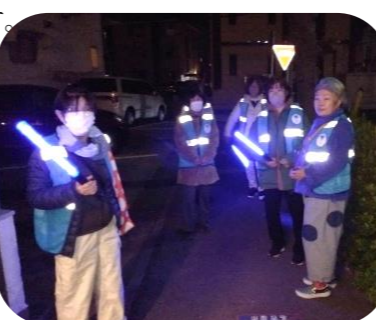
おさんぽパトロール中

昨年年度までは校外委員が全市一斉パトロールとして、年に3回、学区をパトロールしてまいりましたが、今年度よりPTAがエントリ制となり、パトロールの方法も変わりました。全PTA会員が参観日や懇談会等で学校への行き帰りのついでに、黄色い腕章を着用しパトロールを行うというものです。パトロールは通学路上で子どもにとって危ないと思われる環境や、防犯の上で配慮が必要だと思われる環境、ストッパーマーク等に目が行ってしまいます。活動後のアンケートでは「無理なく参加しやすい」や「防犯や安全面について意識する様になった」等の意見が聞かれています。これからも子ども達が安全に過ごせる様に見守ってまいります。